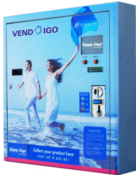
സാനിറ്ററി നാപ്കിൻ വെൻഡിംഗ് മെഷീൻ

ശുചിമുറിയിൽ സ്ഥാപിച്ചിരിക്കുന്നത്. മൂന്നു നാപ്കിൻ അടങ്ങിയ പായ്ക്കറ്റാണ് പത്ത് രൂപയ്ക്ക് ലഭിക്കുക. വിപണിയിൽ ലഭ്യമാകുന്ന നാപ്കിനുകളുടെ വിലയേക്കാൾ കുറവാണ്. ഉപയോഗിച്ച നാപ്കിനുകൾ നിർമാർജ്ജനം ചെയ്യുന്നതിന് ഇൻസിനേറേ