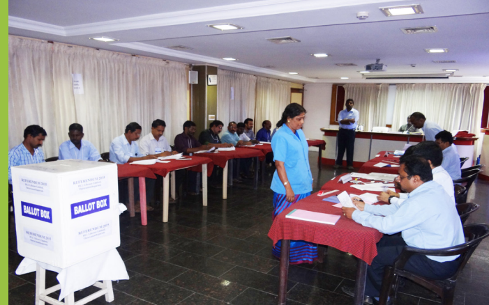
മെയ് 15ന് പേരൂർക്കട ഫാക്ടറിയിൽ നടന്ന ഹിത പരിരോധനയിൽ ജീവനക്കാർ വോട്ട് രേഖപ്പെടുത്തുന്നു.