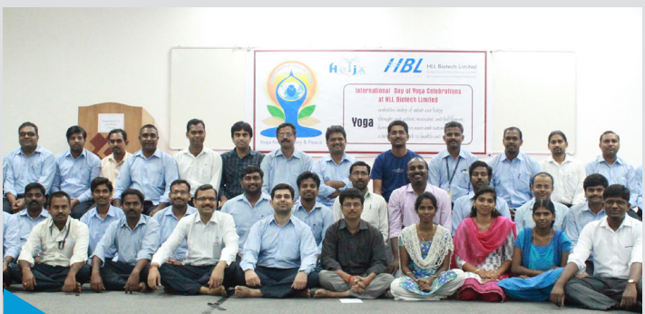
രാജ്യാന്തര യോഗ ദിനാഘോഷത്തിന്റെ ഭാഗമായി എച്ച്ബിഎല്ലിൽ ജൂൺ 5 ന് നടന്ന യോഗ ദിന പരിപാടി.

യോഗയിലെ തുടക്കക്കാർക്കായി സുര്യനമസ്കാരം, പ്രാണായാമം, മെഡിറ്റേഷൻ എന്നിവയാണ് പരിശീലിപ്പിച്ചത്. ജൂൺ 21ന് രാജ്യാന്തര യോഗ ദിനമായി ആഘോഷിക്കുന്നതിന് 177 രാജ്യങ്ങളുടെ പിന്തുണയോടുകൂടിയു എൻ പ്രമേയം അംഗീകരിച്ചിട്ടുണ്ട്. ഇതിന്റെ ഭാഗമായി ഇന്ത്യയിലുടനീളം യോഗ ദിന പരിപാടികൾ വ്യാപിപ്പിക്കാൻ പ്രധാനമന്ത്രി നിർദ്ദേശിച്ചിട്ടുണ്ട്. ഇതിൽനിന്നും ആർജവമുൾക്കൊണ്ടാണ് എച്ച്ബിഎല്ലിൽ യോഗദിന പരിപാടി സംഘടിപ്പിച്ചത്.