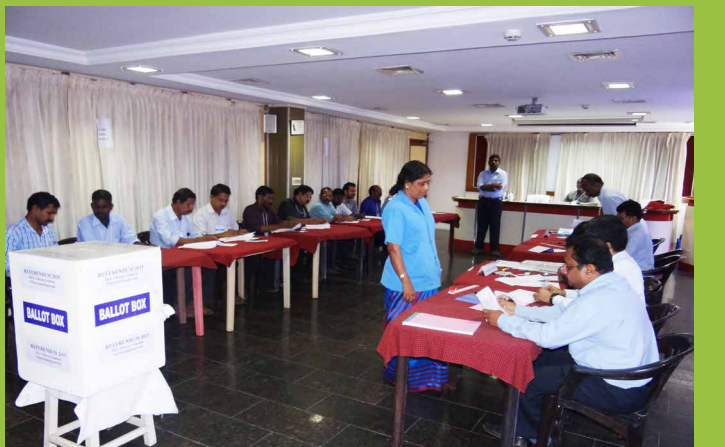
पेरुरकड़ा फैक्टरी में मई 15 को चलाए गए जनमत संग्रह में कर्मचारीगण अपना मतदान देते हैं।