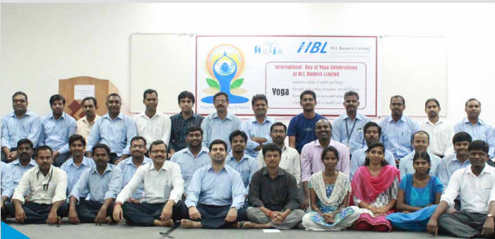
राष्ट्रीय योगा दिवस समारोह के तत्वावधान में 5 जून को एच बी एल में आयोजित योगा दिवस कार्यक्रम