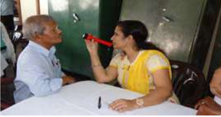
एचएलएल पेरुरकडा फैक्टरी में 15 नवंबर 2018 को आयोजित मुफ्त चिकित्सा शिविर।