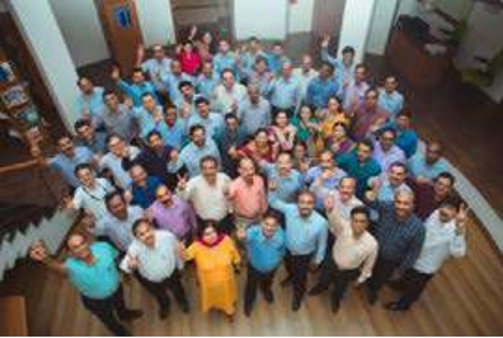
टीम एचएलएल : 30-31 जनवरी 2019 को कॉर्पोरेट अनुसंधान एवं विकास केंद्र में आयोजित वार्षिक योजना कार्यशाला 2019 के बाद एचएलएल के वरिष्ठ प्रबंधन टीम।