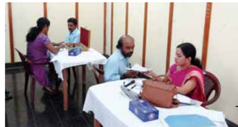
Free eye testing camp organised for the employees of Peroorkada Factory.