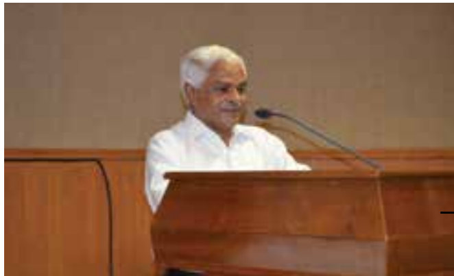
Justice C.N Ramachandran Nair, Former Judge, High Court of Kerala, on 'Litigation by Corporates: Experience as Lawyer and Judge'.