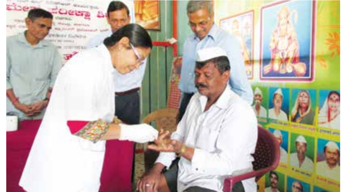
A free blood sugar check up camp was organised in association with SPANDANA and HLFPT at Kanagala on 29 December 2015. 181-villagers participated in the camp.