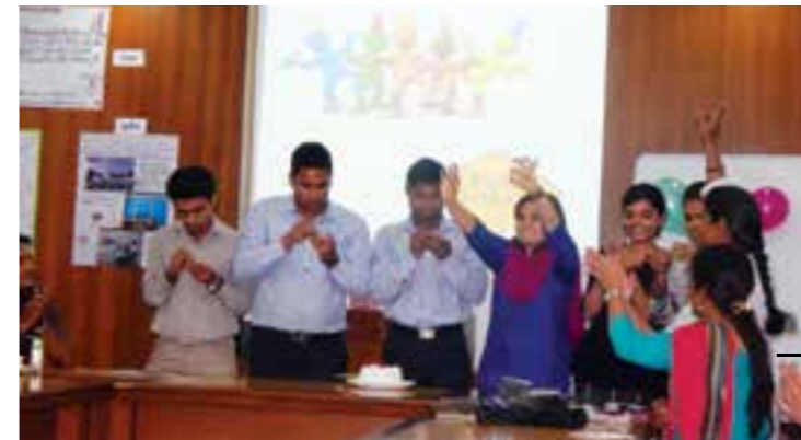
'Connecting Hearts' an employee engagement activity at Delhi Office.