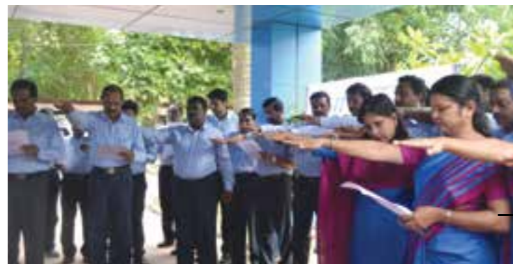
Employees taking pledge as part of Vigilance Awareness Week.