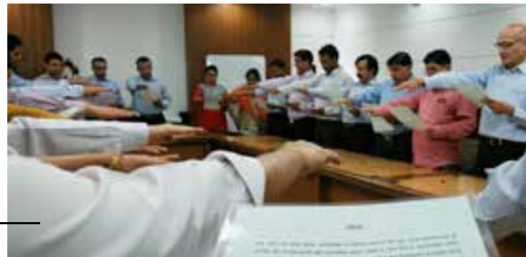
Vigilance Awareness week celebration.