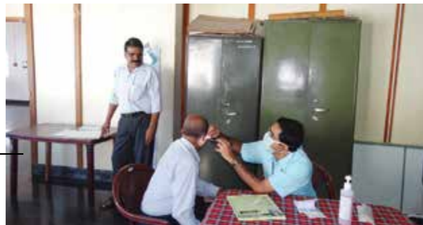
Medical camp for early detection of cancer was organised in association with Regional Cancer Centre, Thiruvananthapuram at Peroorkada Factory.