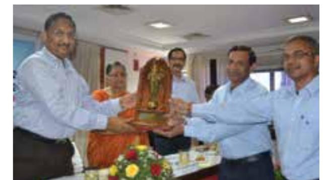
Kanagala Factory received Chal Jayanthi Award for effective utilisation of Hindi in their official communications.