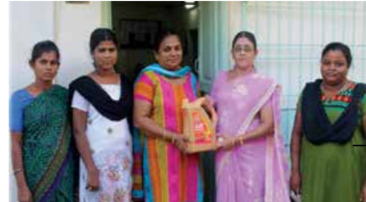
Connect Club- CMO employees club distributed groceries such as oil and rice for the Orphanage 'Jeevan Roshini Home' at Chennai.