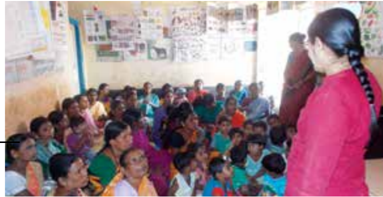
'Menstrual Hygiene Awareness Programme' held at Anganwadi Centres for Women & High School students at Kanagala village.