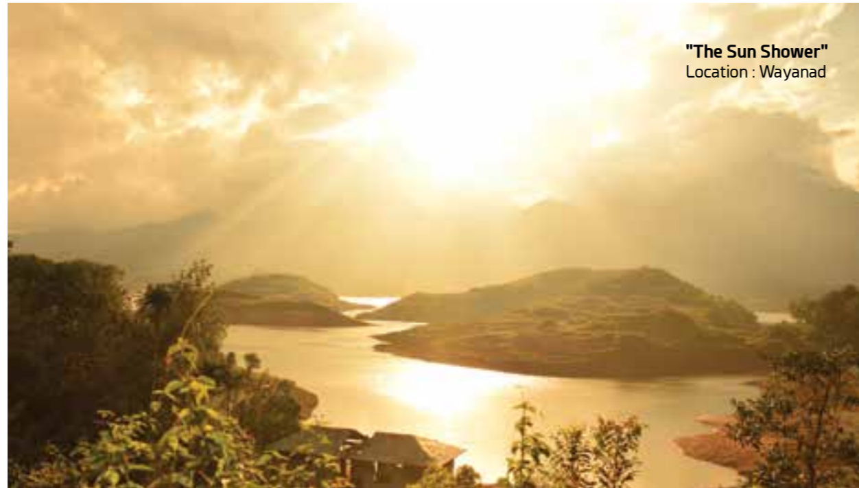
"The Sun Shower" Location : Wayanad

This was a gift by the sun after a mild summer rainfall. The pic was taken at Banasura Sagar Dam (Reservoir - Forest side) in Wayanad . I saw a small creek in the clouds through which Sun Spotlight was hitting the waters. Felt as if something special is on offer. Waited for another quarter of an hour and then there came the SUN SHOWER. One of my best pictures.