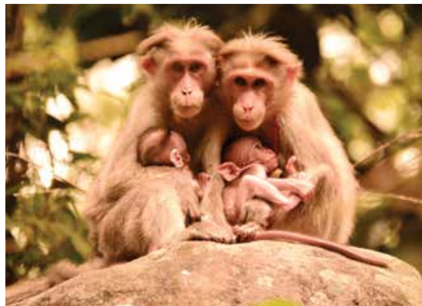
"The Family" Location: Edakkal Caves, Wayanad

This was a gift by the sun after a mild summer rainfall. The pic was taken at Banasura Sagar Dam (Reservoir - Forest side) in Wayanad . I saw a small creek in the clouds through which Sun Spotlight was hitting the waters. Felt as if something special is on offer. Waited for another quarter of an hour and then there came the SUN SHOWER. One of my best pictures.