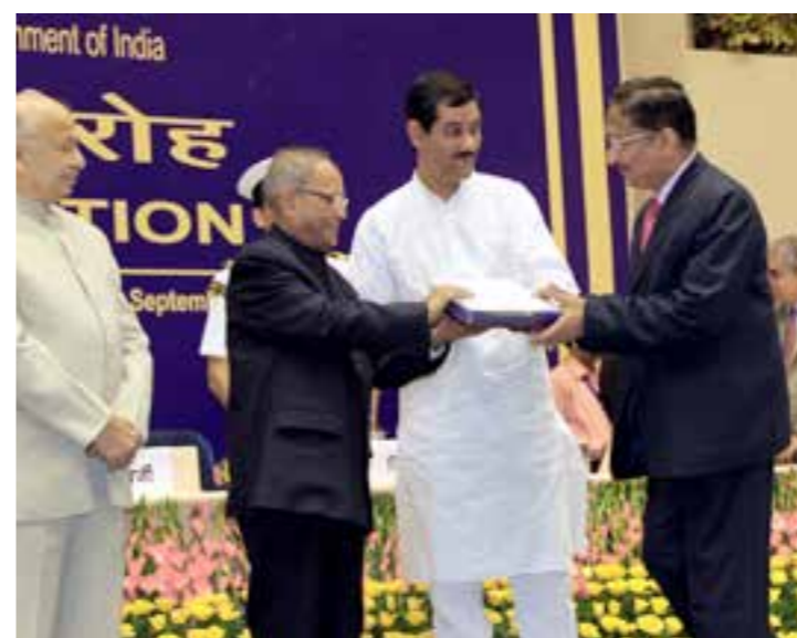
HLL C&MD receiving Rajbhasha Kirti Puraskar from President of India

The company has been bagging several prestigious awards and recognitions both at national and international levels. The major awards include Raj Bhasha Kirti Puraskar consecutively for the 9th time, various Innovation Awards and Safety and Pollution Awards.