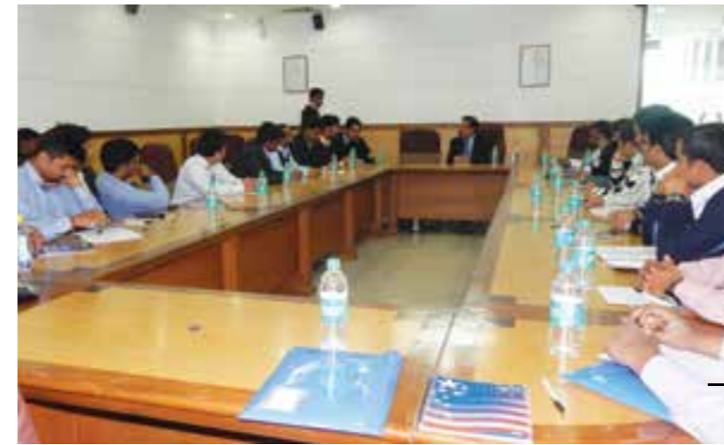
Induction Training of newly recruited Management Trainees, held on 28 December 2015.