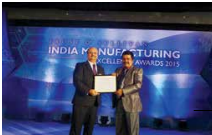
HLL Peroorkada Factory received Frost & Sullivan Manufacturing Excellence Award 2015 in Silver Category in Mumbai.