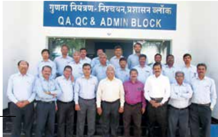
Training Programme on 'Strategy & Transformation'.