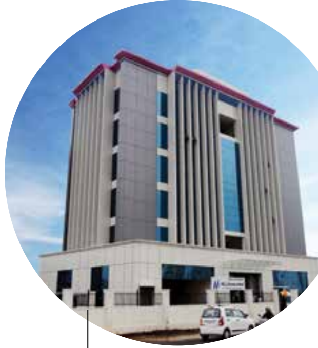
एचएलएल भवन - मुंबई