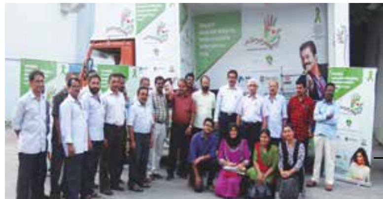
Organ donation camp conducted in association with Punarjani at HLL Peroorkada Factory.