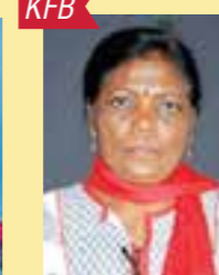
N.D. Madar SG-III