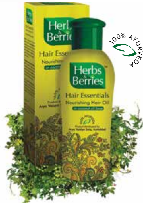
ഹെർബ്സ് & ബെറിസ് ആന്റി ഡാൻഡ്രഫ്റ്റ് ഹെയർ ഓയിലും ലഭ്യമാണ്.