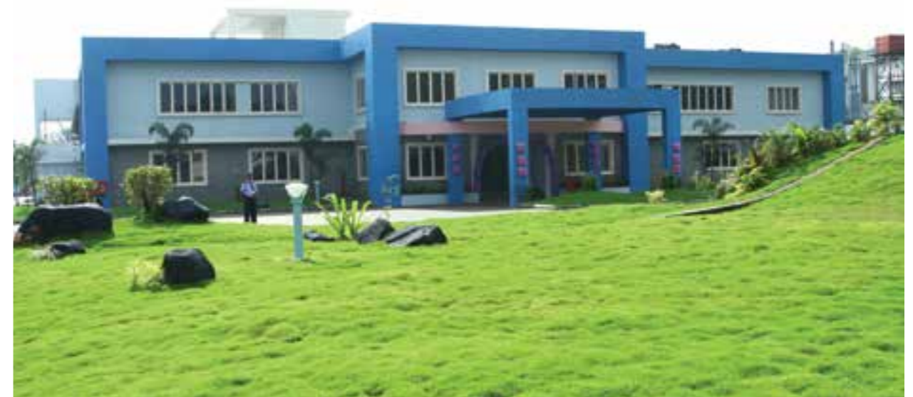
Irapuram Factory, Kochi