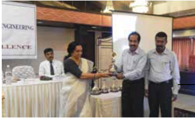
HLL Akkulam Factory received recognition in productivity contest 2015 conducted by Indian Institute of Industrial Engineers (IIE), Thiruvananthapuram Chapter.