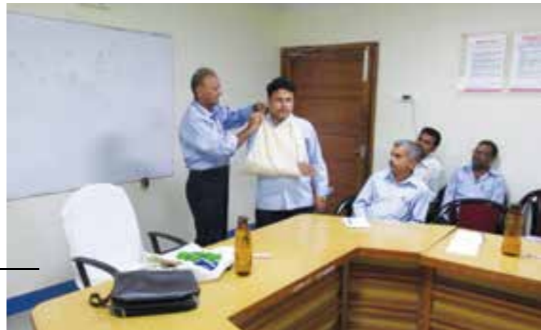
Training Programme on 'First Aid & Fire Fighting' held on 22 December 2015.