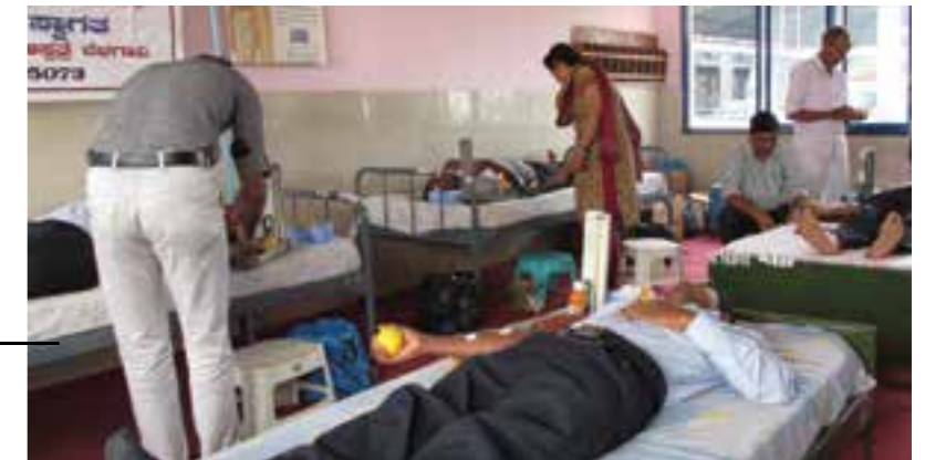
A Blood Donation Camp was organised at HLL-KFB in association with Civil Hospital, Belgavi. 37-employees donated blood during the Camp.