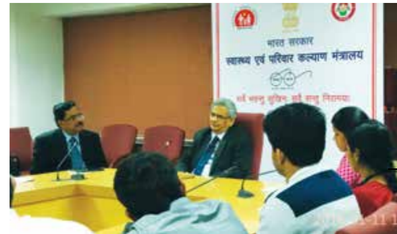
'Talk by Eminent Personalities' – Session for the Management Trainees as part of their induction programme held from 29 December 2015 to 11 January 2016.