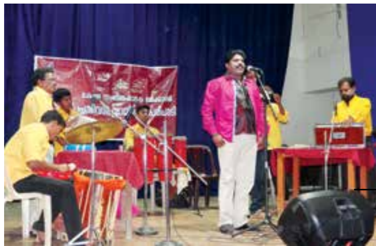
'Kathaprasangam' held at Sargam Auditorium as part of monthly cultural programmes organised by Kerala Sangeetha Nataka Academy.