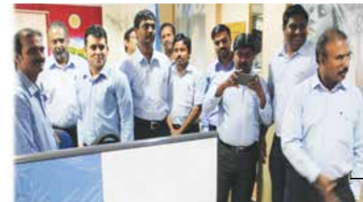
New year celebrations.