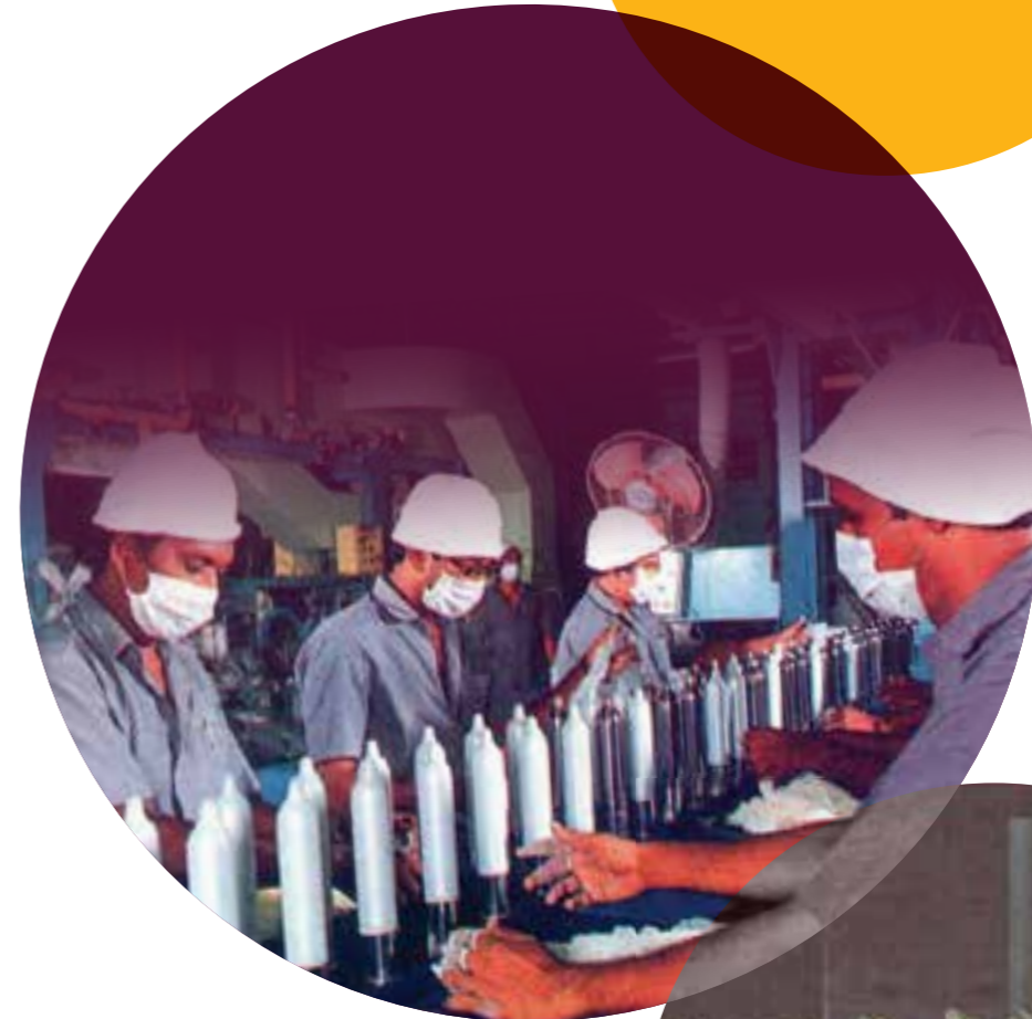
PRODUCTION OF LATEX GLOVES 1992