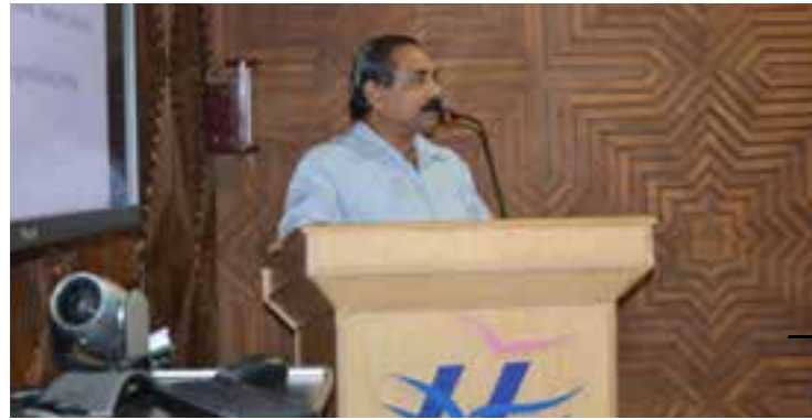
Knowledge sharing Session on Income Tax and Retirement Benefits.