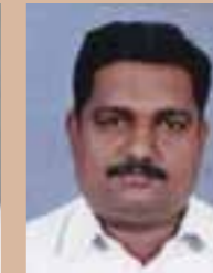
Ullas G.S MG 1