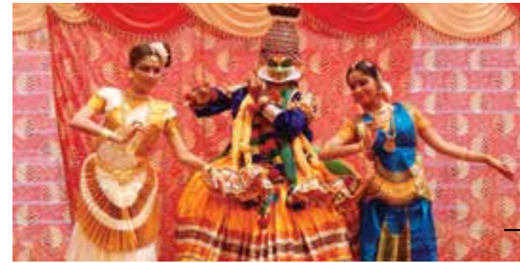
Onam celebrations held at Delhi office.