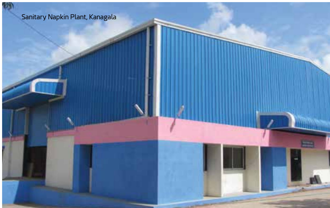
Sanitary Napkin Plant, Kanagala