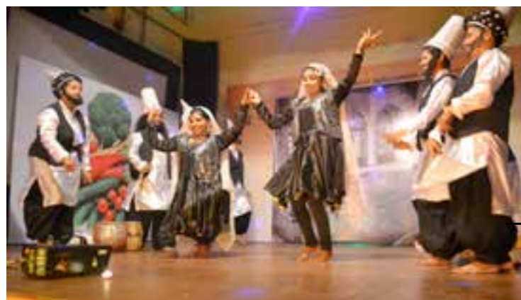
Dance performance by the members of Pink Ladies Forum during the New Year celebrations hosted by the Recreation Club.