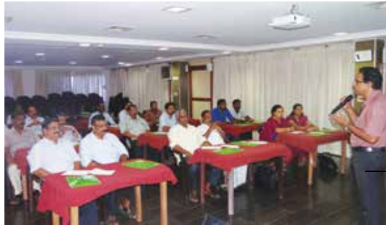
'Training for operator employees' by the instructors of Government Industrial Training Institute, Chackai.