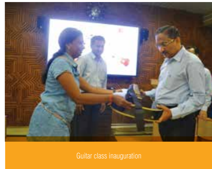
Guitar class inauguration