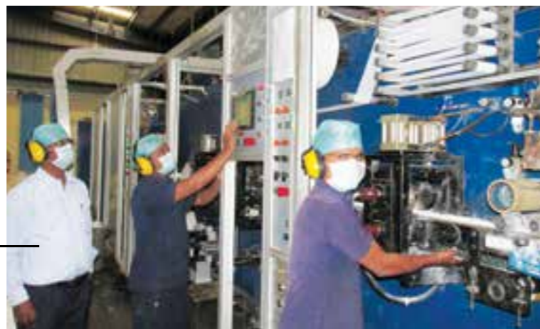
Audiometric Test organised for the employees working in Sanitary Napkin Plant and Boiler on 27 December 2015.