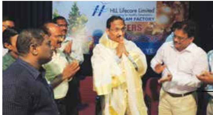
New Year celebration conducted on 27 December 2015 at Sargam Hall.