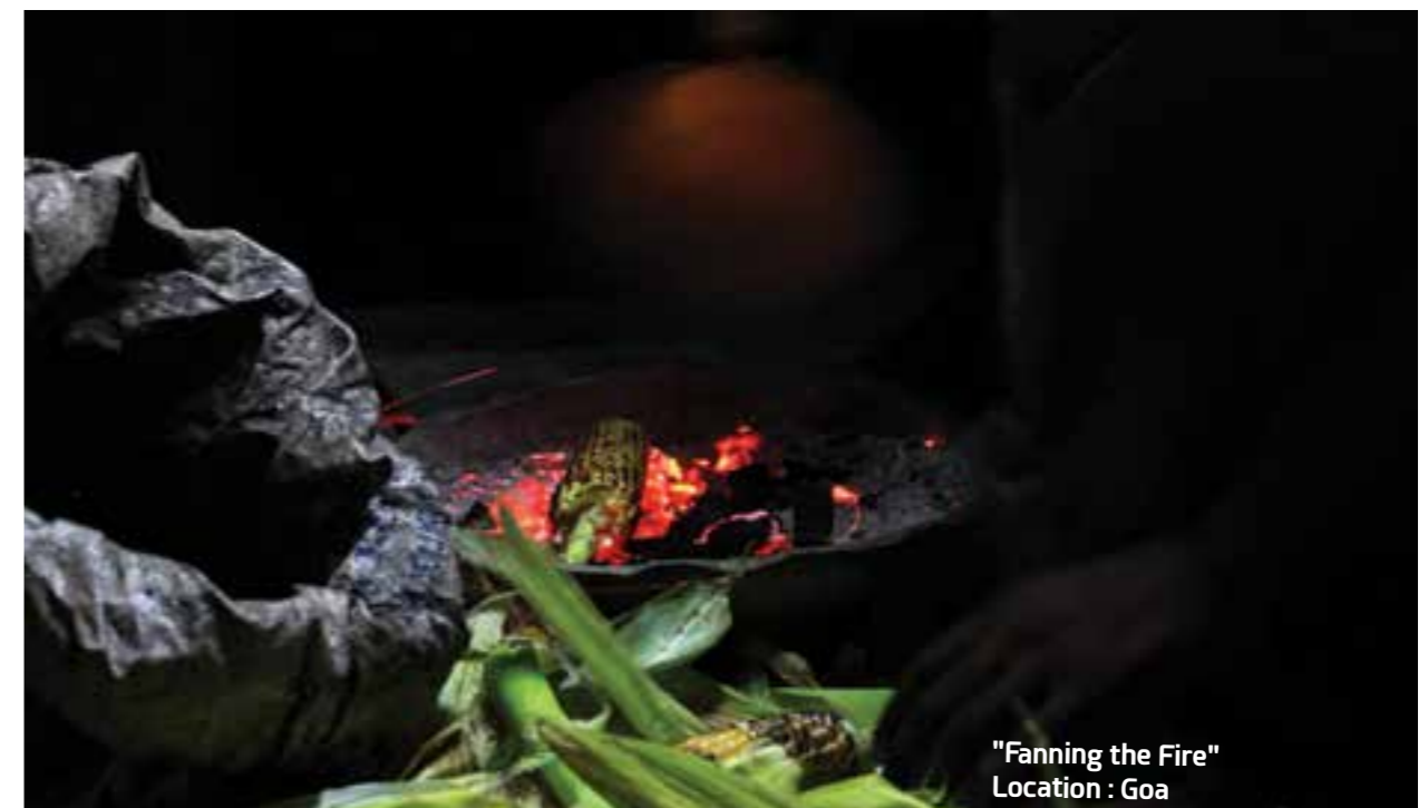
"Fanning the Fire" Location : Goa