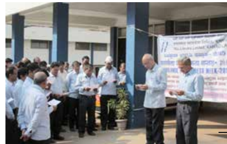
Vigilance Awareness Week celebration.