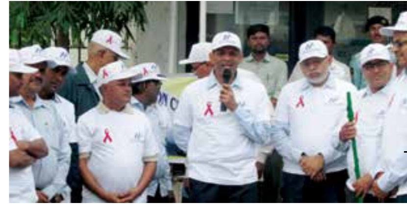
A Motor Cycle Rally was organised from HLL-KFB to Sankeshwar city on World AIDS Day on 01 December 2015.