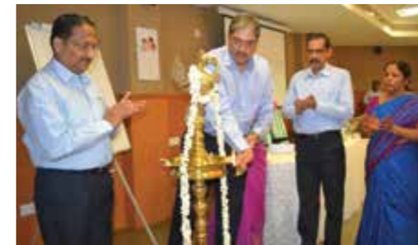
Dr Vishwas Mehta IAS, Principal Secretary (Revenue), Govt of Kerala inaugurating Hindi Fortnight Celebrations 2015 and Town Official Language Implementation Committee (Undertaking) on 29 October 2015.