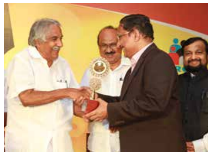
Receiving Maiden NIB Business Icon of the Year 2015 Award from Kerala Chief Minister