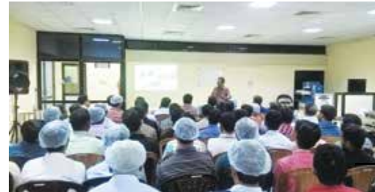
Safety Awareness training held on 7 December 2015.