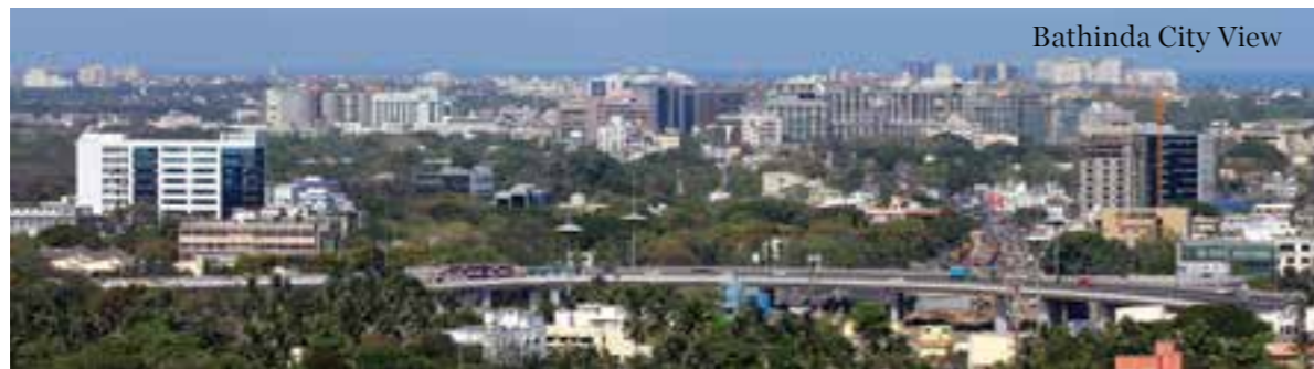
HITES has bagged the project of constructing new AIIMS at Bathinda, Punjab.