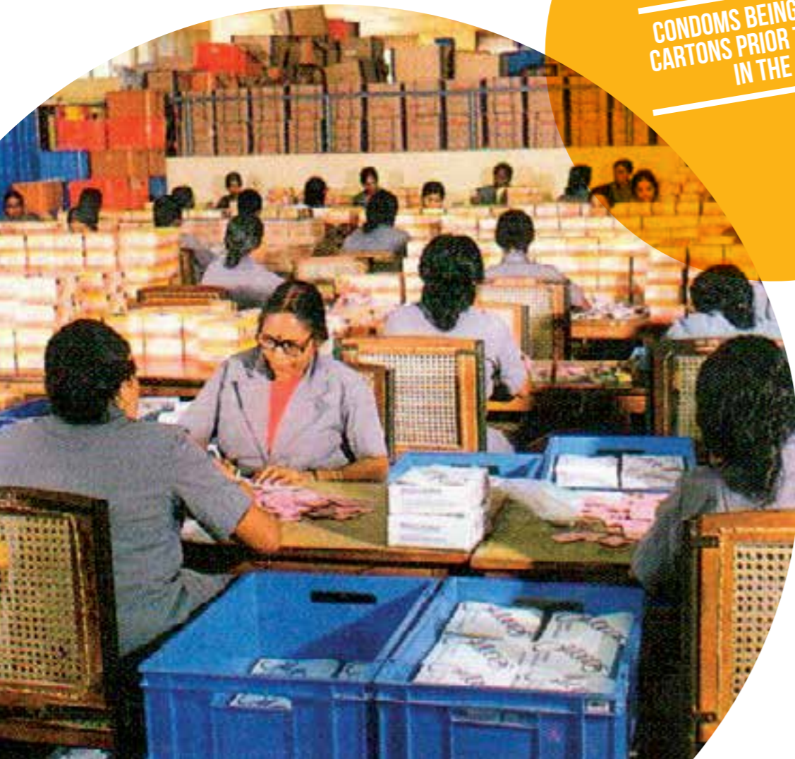
CONDOMS BEING PACKED TO CARTONS PRIOR TO DESPATCH IN THE 80'S