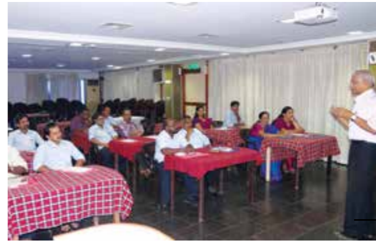
Training on 'Safety & Quality Awareness'.