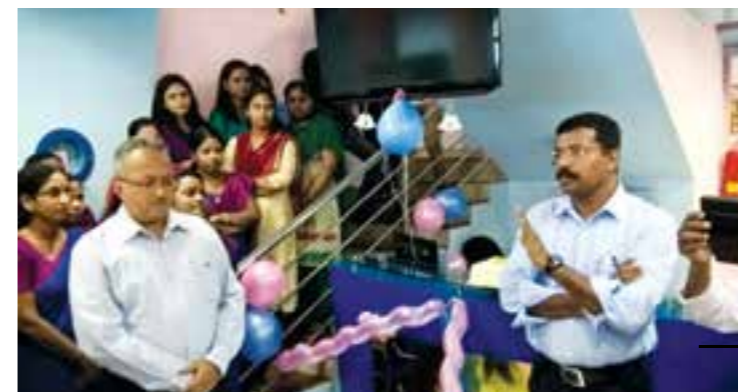
New Year Celebrations.