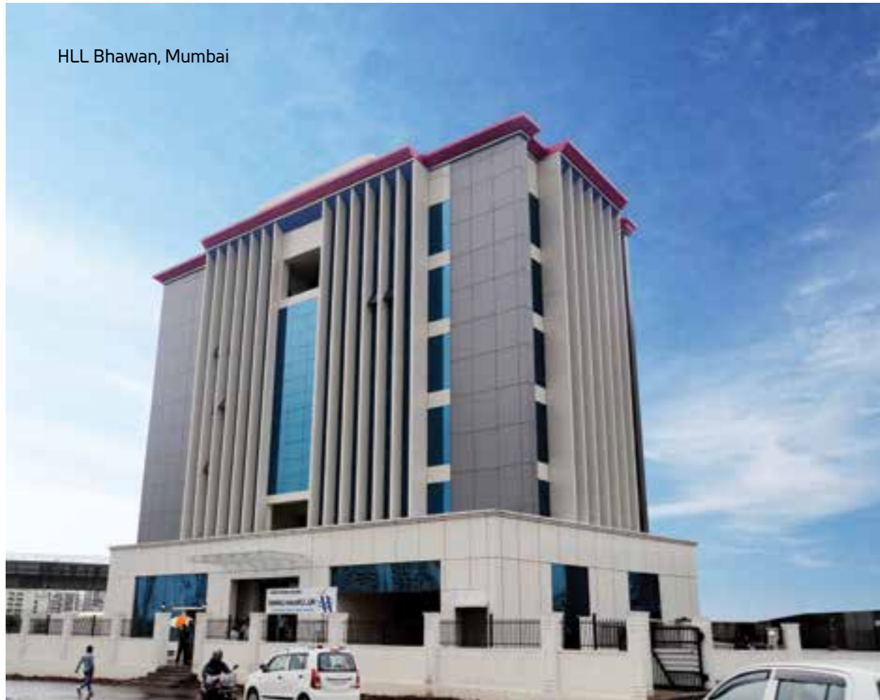
HLL Bhawan, Mumbai