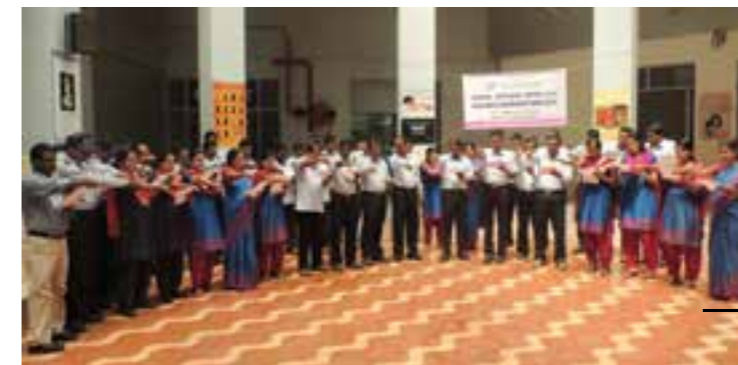
'Vigilance Awareness Week' Celebration.