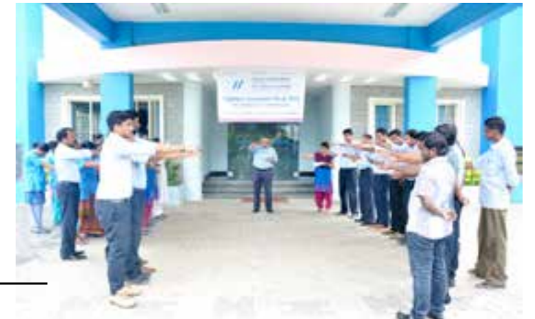
Vigilance Awareness Week celebration.