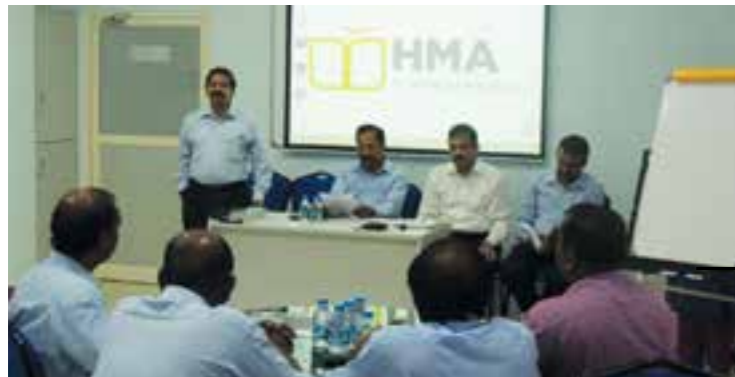
One day workshop on 'You-the Change Officer' for the officers of Akkulam Factory on 2 December 2015 at HLL Management Academy, Thiruvananthapuram.