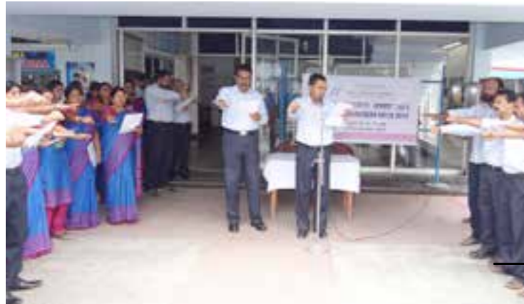
Vigilance Awareness Week 2015 celebration.