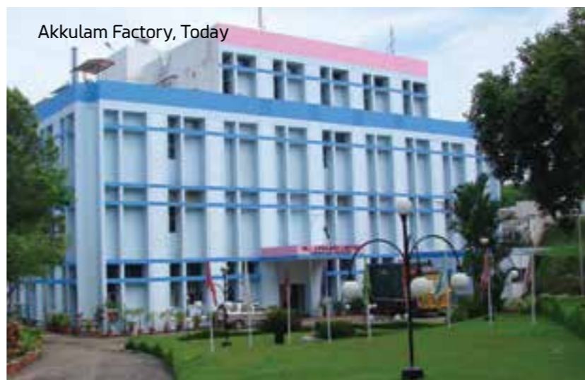
Akkulam Factory, Today