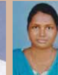
Simi B.S MG 1