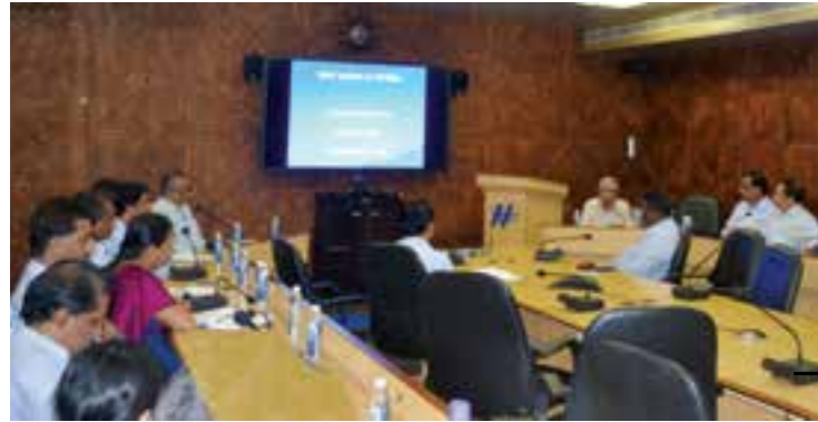
MoU Awareness Workshop.