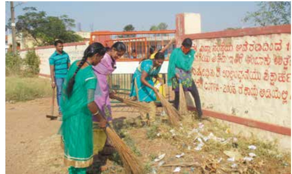
'Swachh Bharat campaign' held at Kanagala village.