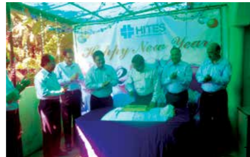
New Year Celebrations at HITES, South.