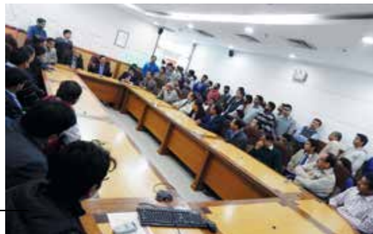
New year celebrations.