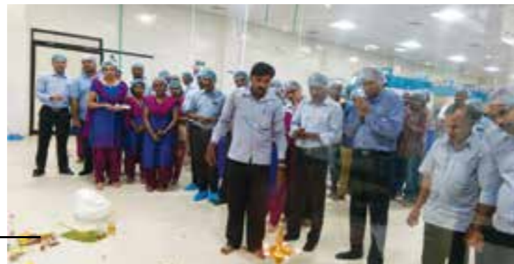
Mahanavami Pooja held on 21 October 2015.