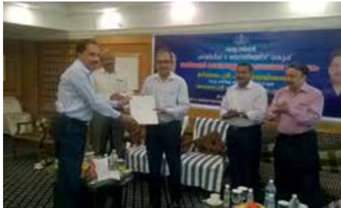
HLL Akkulam Factory received First Online Payment and Registration Award of Factory License from Factories & Boilers.