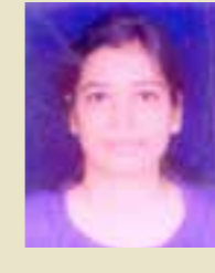
Deepika MT, HITES