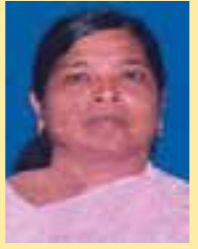
Raichamma Don MG6