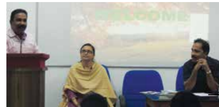
Training on 'Improvement in Behavioural Concepts.