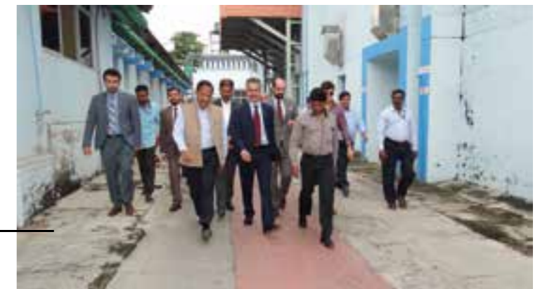
A team from Ministry of Public Health of Islamic Republic of Afghanistan visited the Factory.