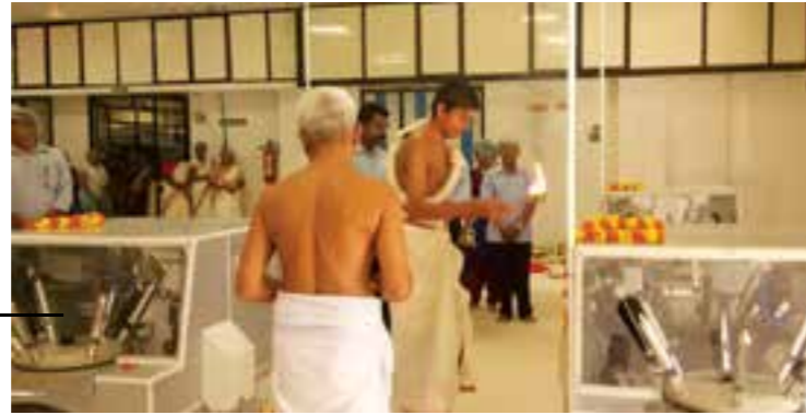
Installation of 4 Nos. of new Richter Make Electronic Testing Machines.