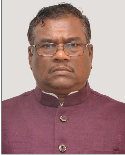
श्री फगगन सिंह कुलस्ते Shri Faggan Singh Kulaste

सम्माननीय स्वास्थ्य और परिवार कल्याण संघ राज्य मंत्री Hon'ble Union Minister of State for Health & Family Welfare