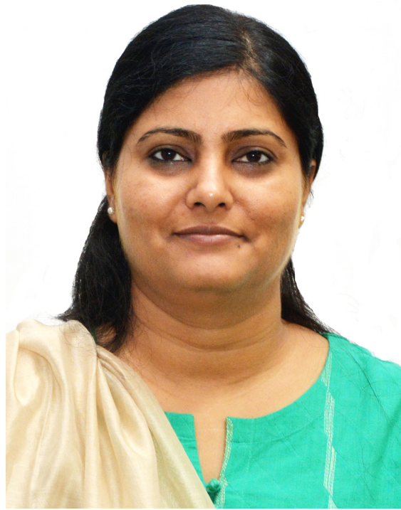
श्रीमती अनुप्रिया पटेल Smt. Anupriya Patel

सम्माननीय स्वास्थ्य और परिवार कल्याण संघ राज्य मंत्री Hon'ble Union Minister of State for Health & Family Welfare